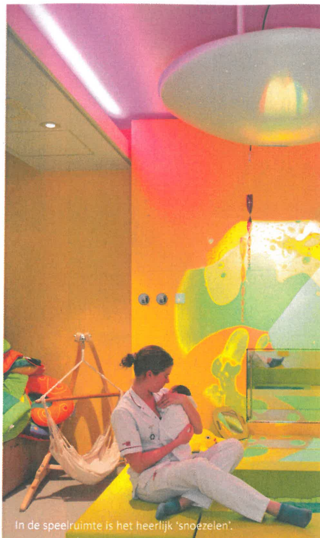
In de speelruimte is het heerlijk 'snoezelen'.