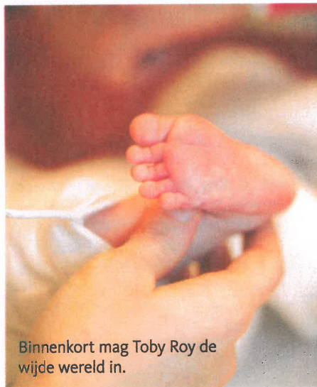
Binnenkort mag Toby Roy de wijde wereld in.