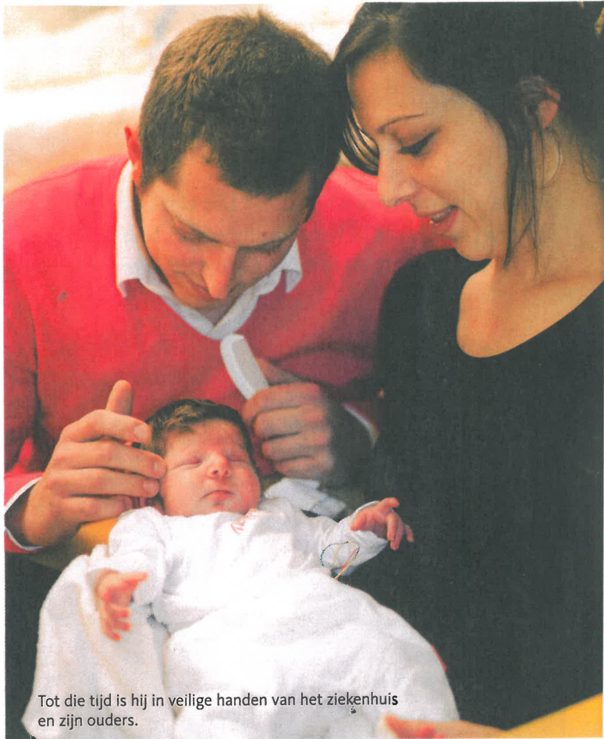
Tot die tijd is hij in veilige handen van het ziekenhuis en zijn ouders.

bij aan dit proces. Neem bijvoorbeeld het voeden. Dit gaat veel beter als moeder en kind ontspannen zijn. Ook op de vorige afdeling stimuleerden we ouders zo veel mogelijk te komen. Dit zorgde wel eens voor logistieke problemen vanwege het ruimtegebrek. Zo hadden we maar één douche waar achttien ouders gebruik van moesten maken! De huidige situatie is een wereld van verschil met de oude. Onze afdeling heeft zelfs twee suites waar een heel gezin kan verblijven. Als een baby ernstig ziek is, kunnen we hem en zijn ouders wel een mooie, rustige plek geven. Maar ook op blije momenten biedt de suite uitkomst. Bijvoorbeeld wanneer een baby al naar huis mag, maar ouders nog onzeker zijn over hoe ze hun kind moeten verzorgen. Zij kunnen hier oefenen."