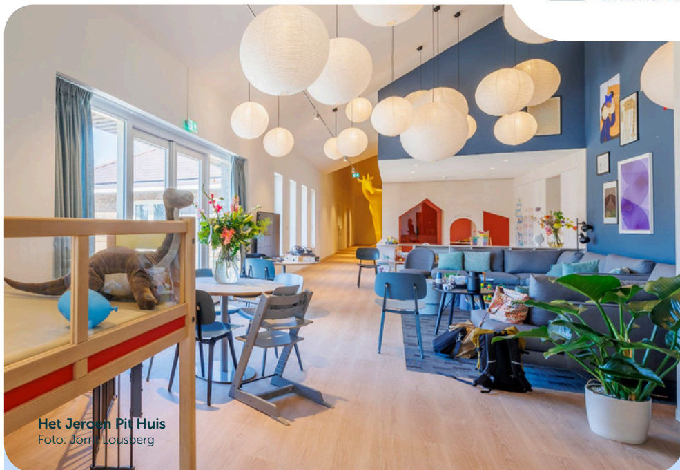
Het Jeroen Pit Huis